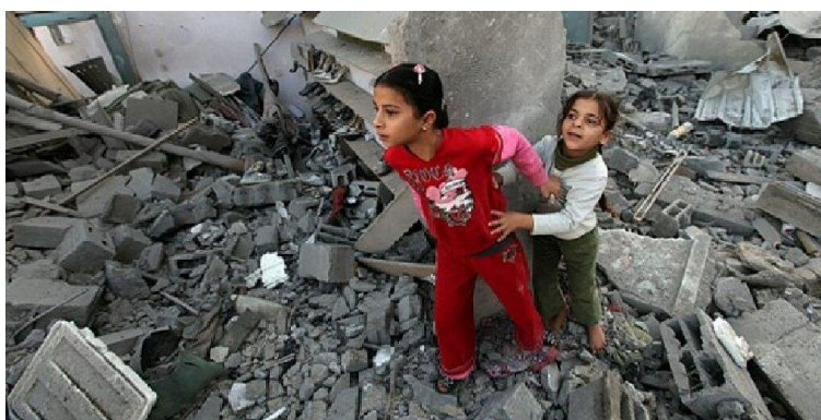
تصویری دلخراش از وحشت کودکان غزه در میان بمباران‌های بی‌پایان هوایم‌های اسرائیل

ترامپ تا نوامبر ۲۰۲۲ جایگاهش را در فهرست میلیاردهای مجله فوربس کمی بالاتر برده و در رده ۸۹۲ میلیاردهای جهان قرار گرفته در حالی که در ژوئن ۲۰۲۲ در رده ۱۰۱۲ قرار داشت.