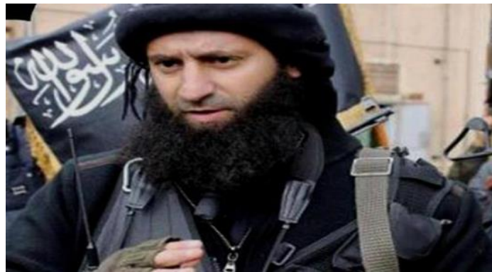
ابو محمد الجولانی، رهبر گروه تروریستی هیئت تحریر الشام

محمد حنان، یک از شهروندان عفرین به فرات نیوز گفته است: «انگار ظلم در عفرین کافی نبود، با آواره کردن ما از شهبا بار دیگر با ظلم مواجه شدیم. هم‌چنین در طول مسیر مورد آزار لفظی تبه‌کاران قرار گرفتیم. عفرین و شهبا سرزمین مردم کورد است و سرزمین مردم کورد باقی خواهد ماند. هیچ جایی برای دولت ترکیه و تبه‌کارانش در عفرین و حتی در سوریه وجود ندارد. نوزاد ۳ ماهه در مسیر شهبا به رقه بر اثر سرما جان باخت. اردوغان یک قاتل است، دستانش به خون مردم بی‌گناه آغشته است. امیدمان را از دست ندادیم. برای رسیدن به عفرین زمان زیادی نمانده است.»